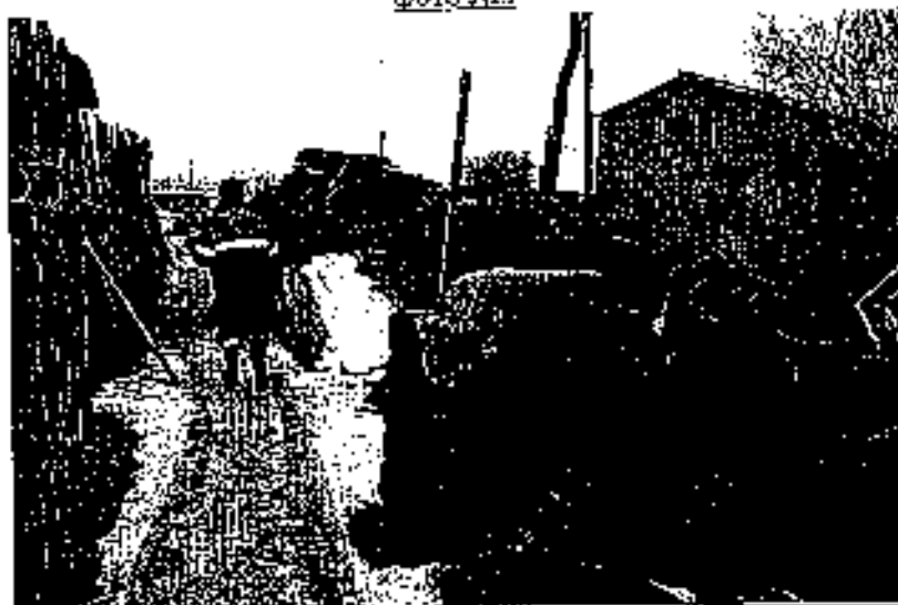
φωτο Νο 4