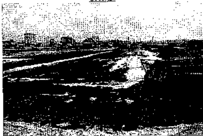
φωτο Νο 5